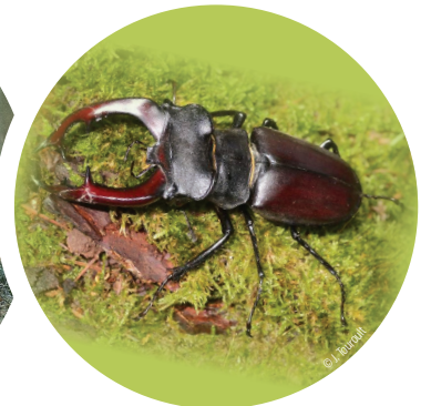
Le lucane cerf-volant mâle est le plus grand insecte d'Europe présent en forêt de Crécy.